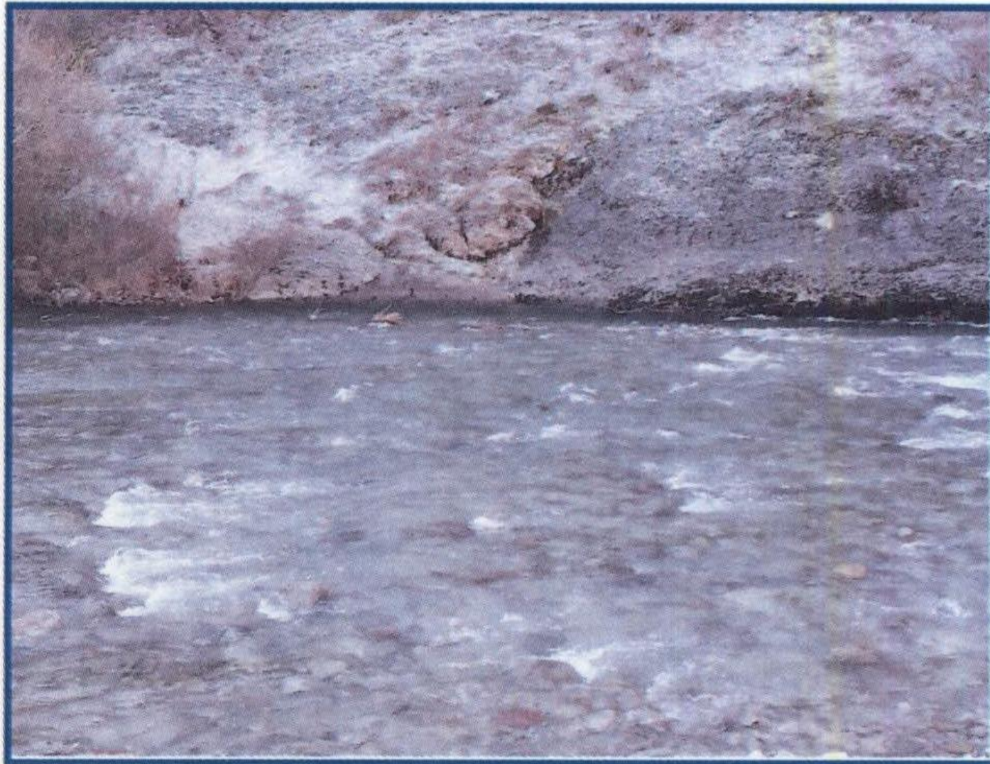
Слика 8. Мерни профил Д (Височица пре улива у акумулацију)