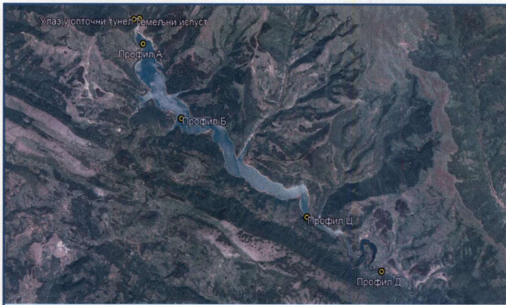
Слика 1. Графички приказ локација узорковања (А- брана, Б- улазна грађевина, Ц-Белски мост, Д- река Височица)