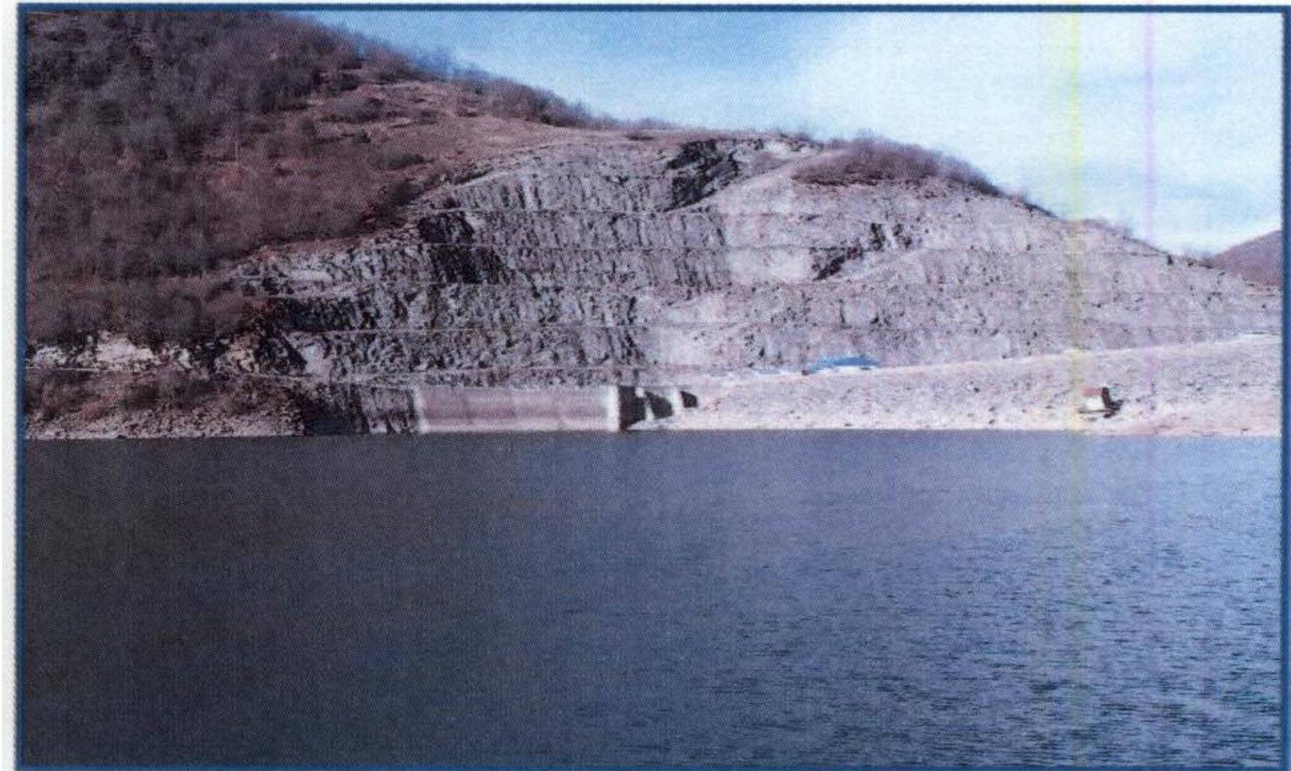
Слика 2. Мерни профил А код бране