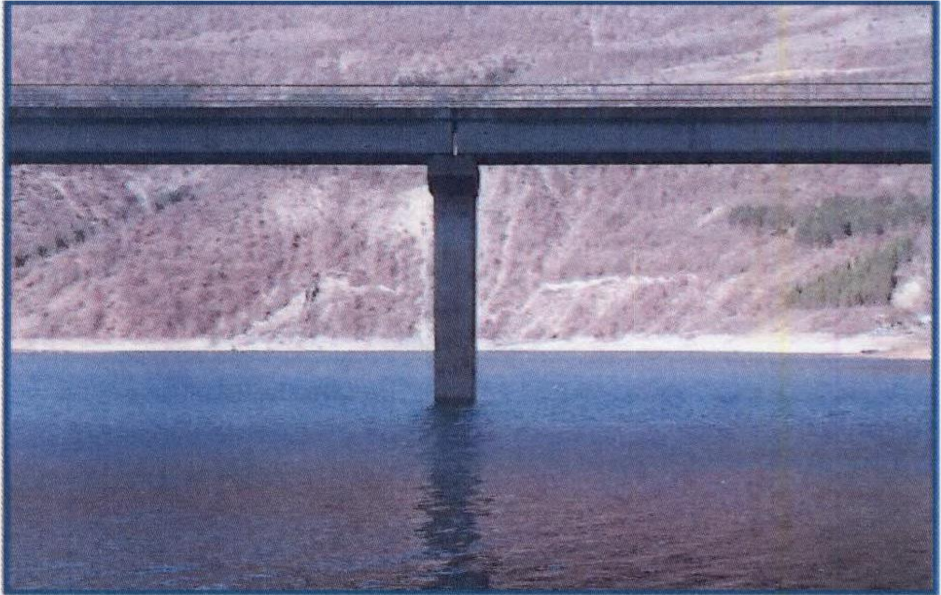
Слика 4. Мерни профил Ц код Белског моста